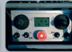
... überzeugende Technik