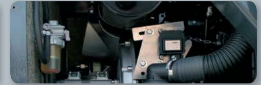
... sparsam & umweltfreundlich!