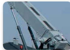
... leicht & leistungsstark!