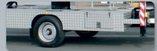
... nützlich & unterstützend!