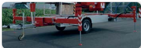
... komfortabel & sicher!