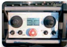
... überzeugende Technik