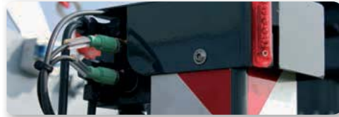
... sicher & zuverlässig!