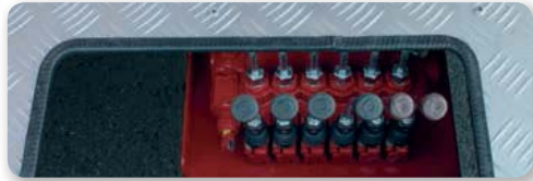
... intelligent & flexibel!